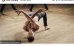
Artistas que fazem recriação artística com o T13Rax Cia. Da dança se apresentam das 19h às 21h numa recriação de Carne Urbana, realizada pela escola de companhias paulistas

A peça discute, a partir da dança urbana contemporânea, as dinâmicas das classes nas cidades