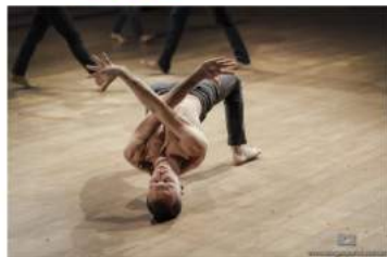
Carne Urbana.