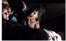
Dança e espetáculo Carne Urbana